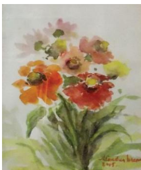
Cârciumărese, acuarică, 18 x 24 cm