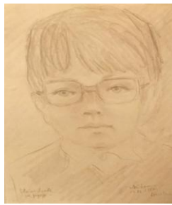
Petri, creion, A4