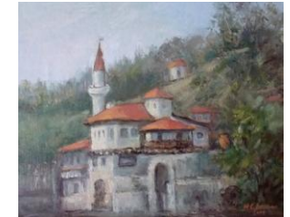
Cuibul linistit, up, 38 x 45 cm