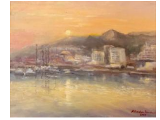
Balcic, up, 37 x 47 cm