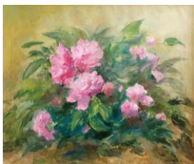
Bujorii din ogradă II, up, 30 x 40 cm