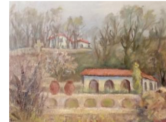
Baia romană (Balcic), up, 37x46 cm