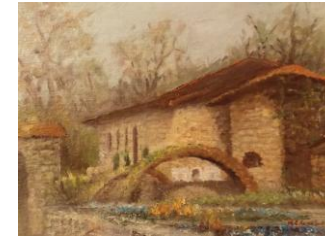
Balcic, cinematograful Reginei Maria, up, 37 x 40 cm

Are lucrări în colecții particulare din țară și străinătate: Belgia, Spania, SUA, Austria, Franța, Italia, Iugoslavia, Canada, Muzeul de Artă Românească Illinois, Elveția, Anglia, Germania, China, Mexic, Florida, Rusia, Republica Moldova.