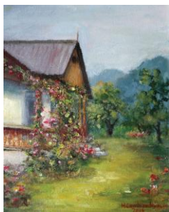
Casa părintească II, up, 35 x 45 cm