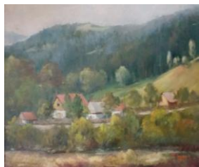
În satul natal, up, 40 x 50 cm