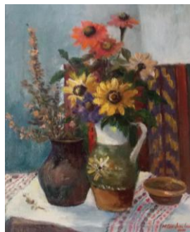
Cadru rustic, up, 35 x 45 cm