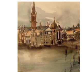
Veneția I, acuarelă, 28 x 20 cm