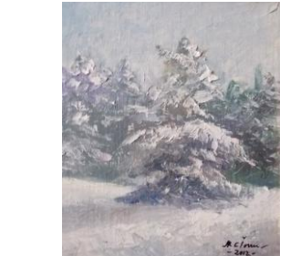
Ninge, up, 20 x 25 cm