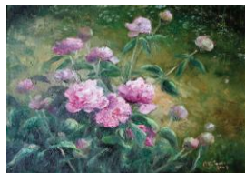
Bujorii din grădină, up, 40 x 50 cm