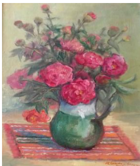
Bujori, up, 38 x 50 cm