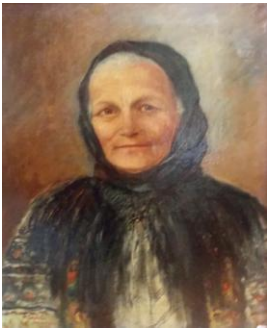
Portretul mamei, up, 35 x 45 cm