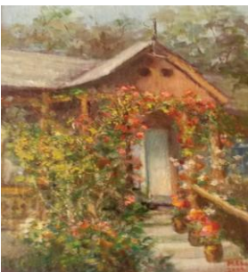
Casa părintească, up, 45 x 32 cm