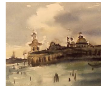
VenețiaII, acuarelă, 28 x 20 cm