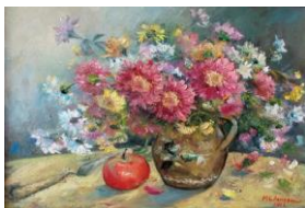
Bogația florilor, up, 30 x 40 cm