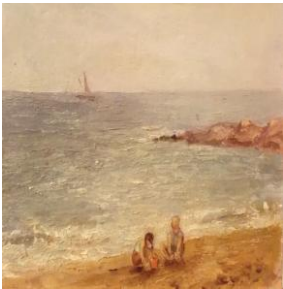
Adunând scoici, 29 x 21 cm