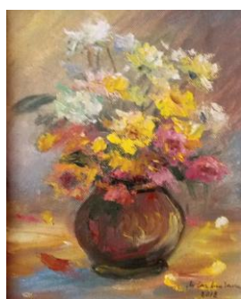
Dalii mici I, up, 18 x 24 cm

“Pentru mine, pictura este apa sfințită ce-mi scaldă sufletul, iar cel mai bun consilier îmi este natura, natura cu tot ce emană din această respirație a pământului care ne îndeamnă să iubim viața. Gingășia florilor mă duce cu gândul spre sufletele curate și frumoase ale copiilor și ale tuturor oamenilor buni.”