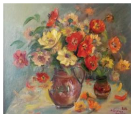
Flori de grădină II, up, 40 x 50 cm