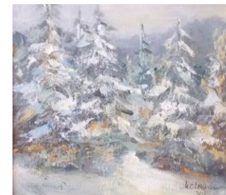
Iarna la munte, up, 20 x 25 cm