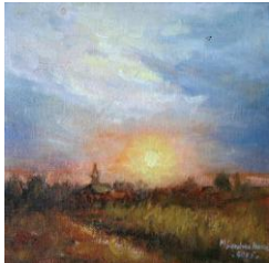
Înserare în Bărăgan, up, 35 x 45 cm